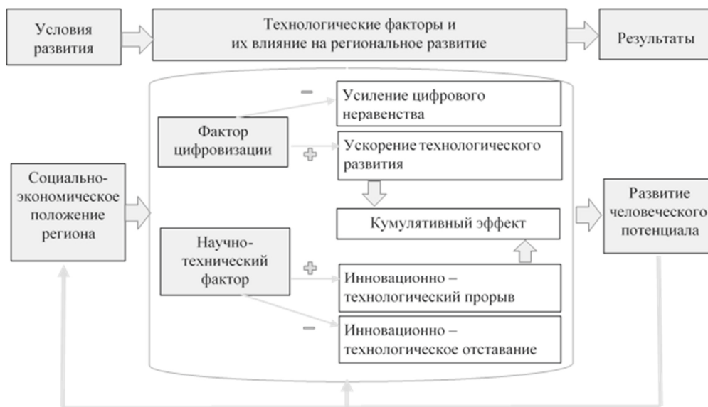
Рис. 1. Модель регионального развития с учетом влияния технологических возможностей региона на развитие человеческого потенциала

В регионах, где цифровые и научно-технические факторы одновременно и активно воздействуют на технологическое развитие территории (на рис. 1 отмечено знаком «+»), возникает кумулятивный эффект, способствующий технологическому прорыву. Развитие человеческого потенциала, которое в исследуемой триаде является результатом, одновременно оказывает воздействие на дальнейшее социально-экономическое развитие региона.