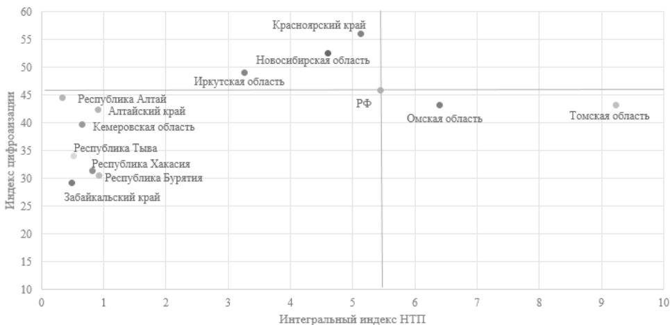
Рис. 3. Позиционирование регионов СФО по критериям: индекс цифровизации, интегральный индекс НТП, 2017 г.