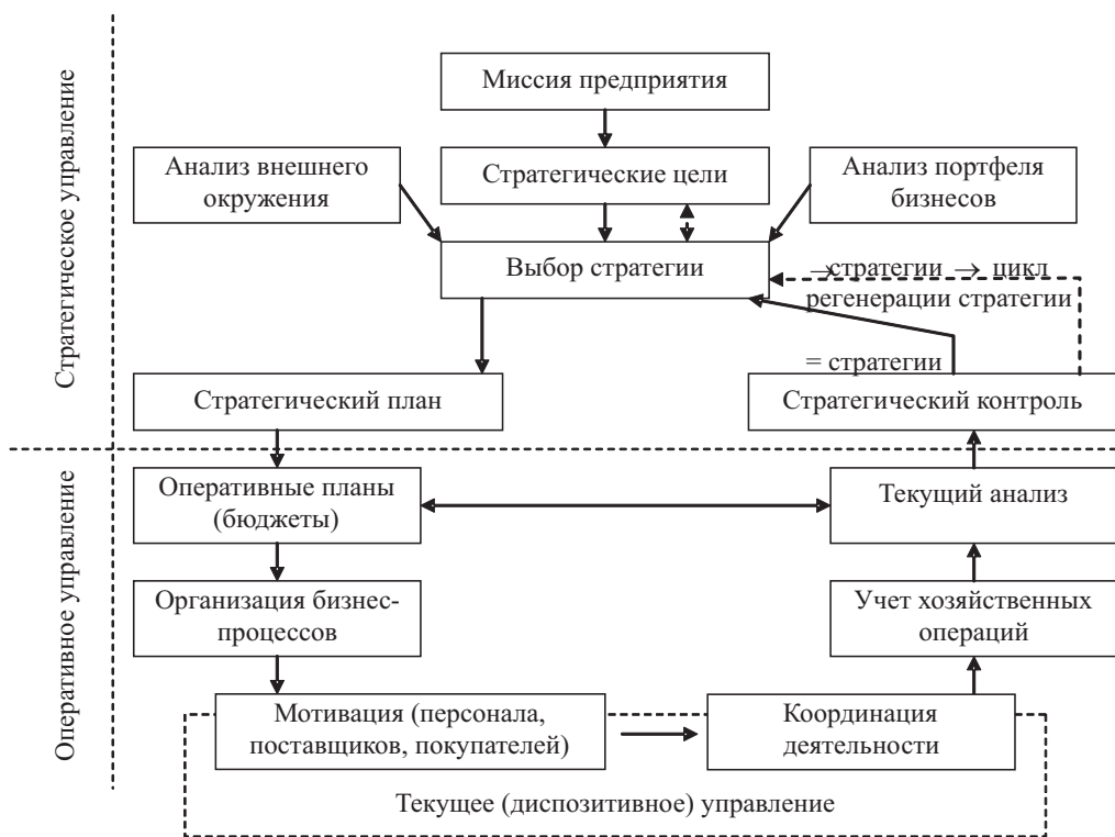
Рис. 2. Цикл стратегического, оперативного и диспозитивного управления предприятием

Теория стратегического управления также основывается на общих методологических подходах к управлению: системном, организационном, процессном и др.